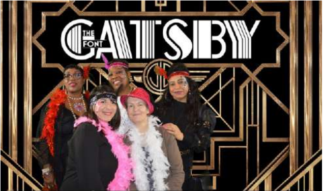
Vœux du personnel 2020