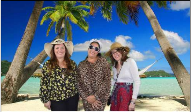
Summer Party - 25 janvier 2020

Retrouvez-vous incrusté en quelques secondes dans un décor drôle et décalé suivant la thématique désirée (les îles, les années 60, disco, Paris Montmartre, la croisière, les villes du monde,...)