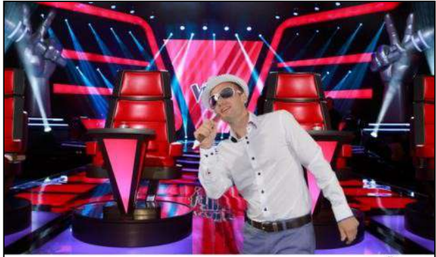
CASING - R - T - AM. 2 juin 2017