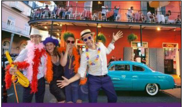
SOIRÉE D'ÉTÉ 2017 Bateau le Louisiana Belle